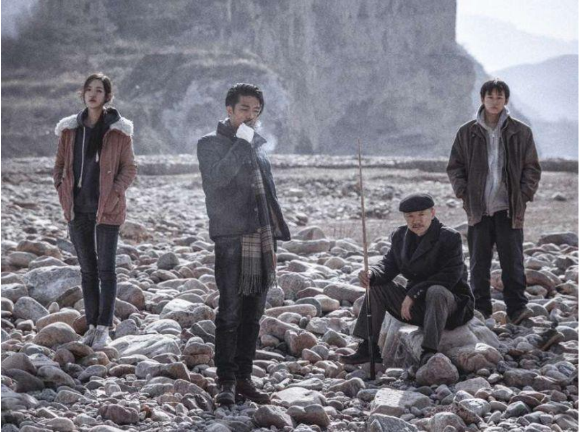
Hu Bo, Da xiang xi di er zuo (An Elephant Sitting Still) , Chine, 2018

Jia Zhangke, 山河故人 (Au-delà des montagnes) , Chine/France/Japon, 2015