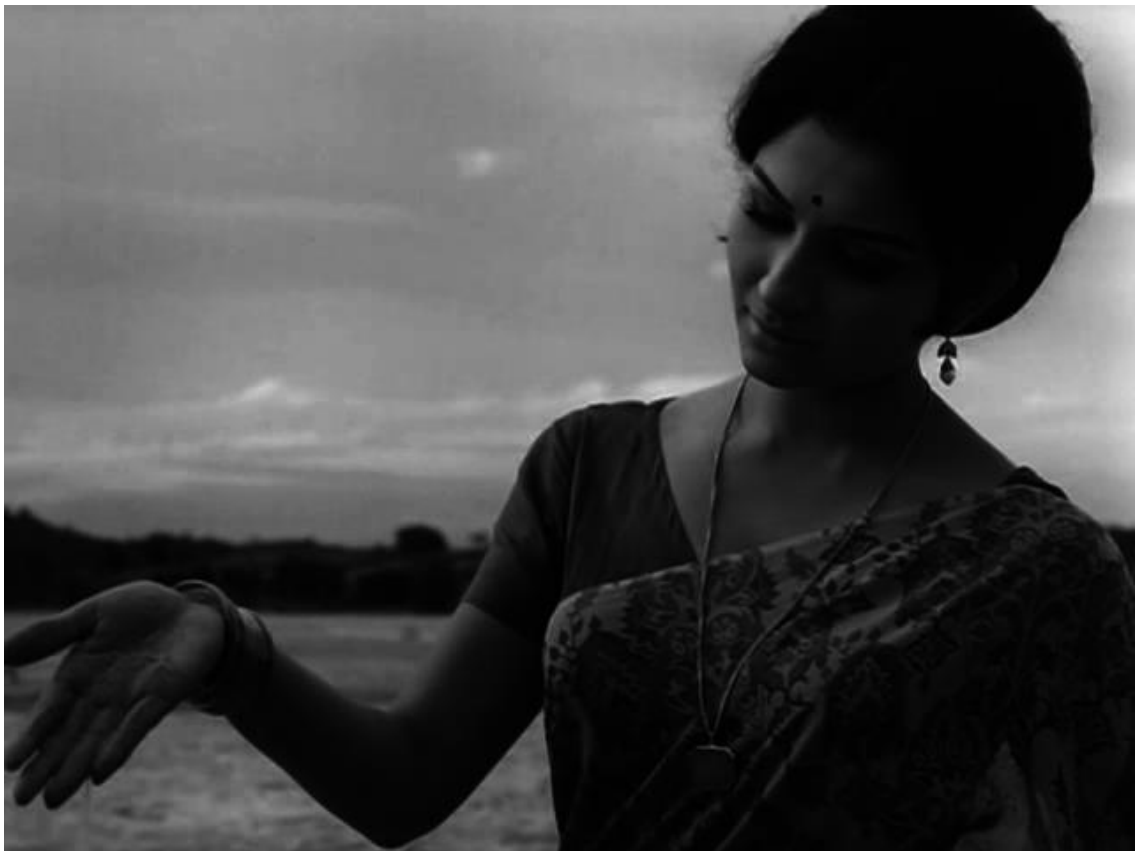
Satyajit Ray, Aranyer Din Ratri (Des jours et des nuits à travers la forêt) , Inde, 1970