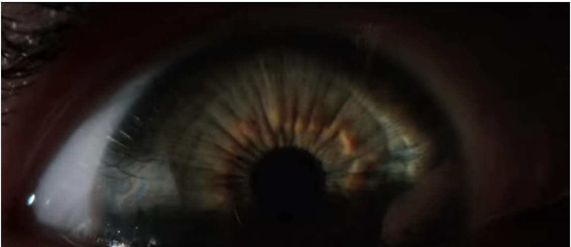
Jonathan Glazer, Under the skin , R-U, 2013