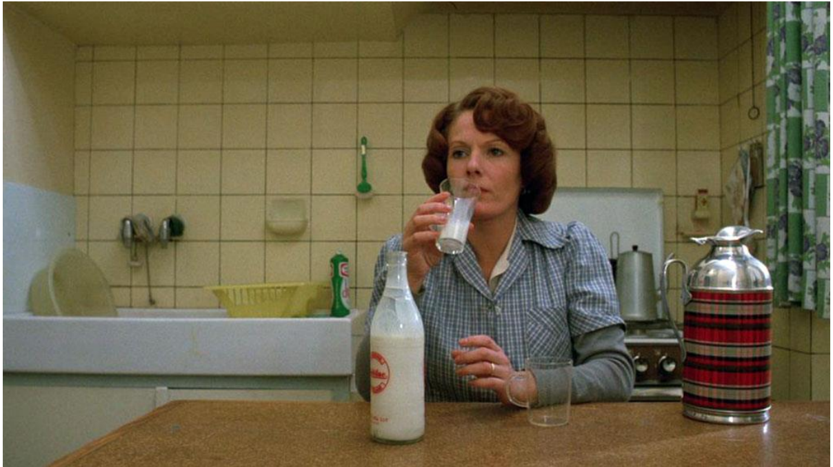
Chantal Akerman, Jeanne Dielman, 23 rue du Commerce, 1080 Bruxelles , Belgique, 1975

Miguel Gomes, As Mil e uma Noites ( Les Mille et Une Nuits ), Tomes 1,2,3, Portugal, 2015