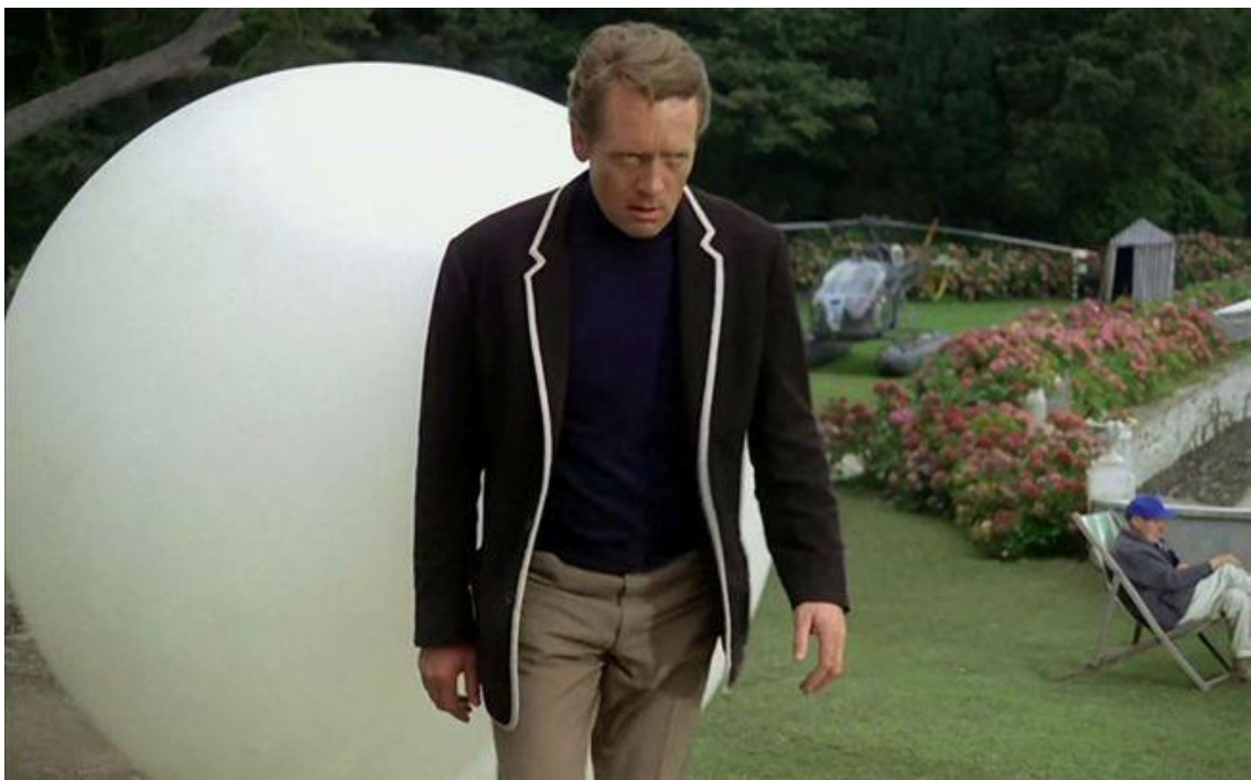
Patrick McGoohan, Le prisonnier , R-U, 1967