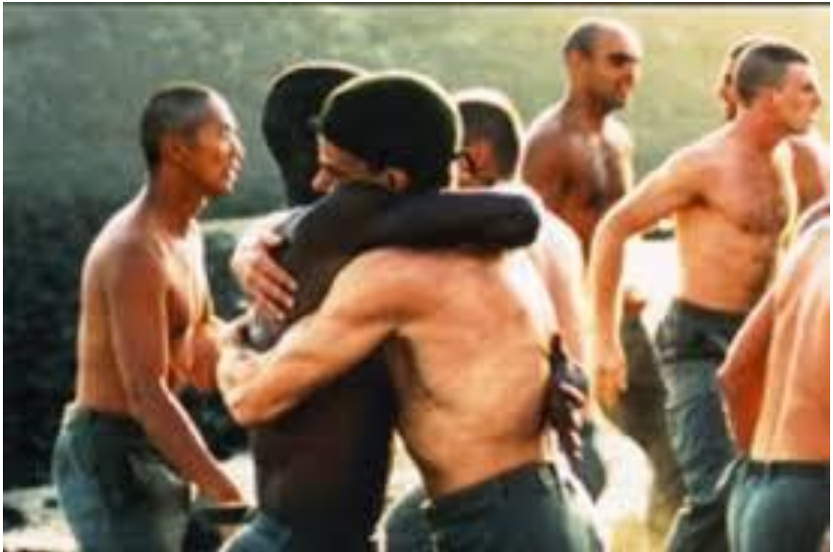
Claire Denis, Beau travail , France, 2000

Martin Scorsese, The Irishman , É-U, 2019