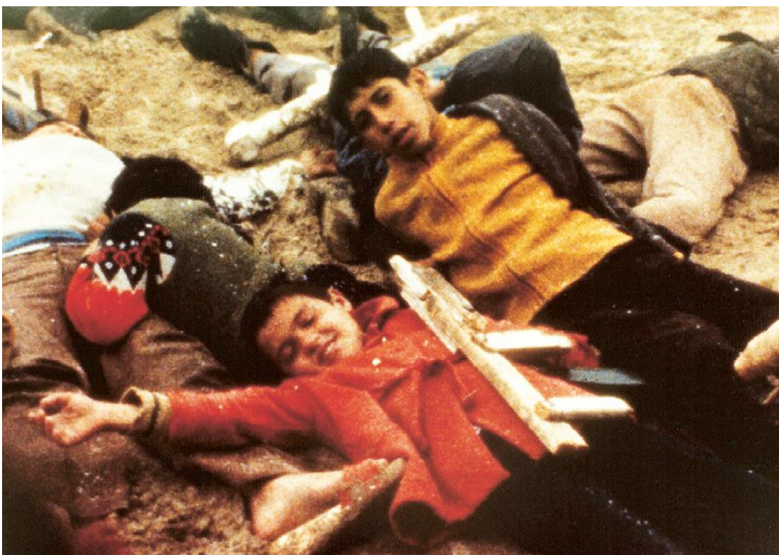
Jocelyne Saab, Les enfants de la guerre , Liban, 1976